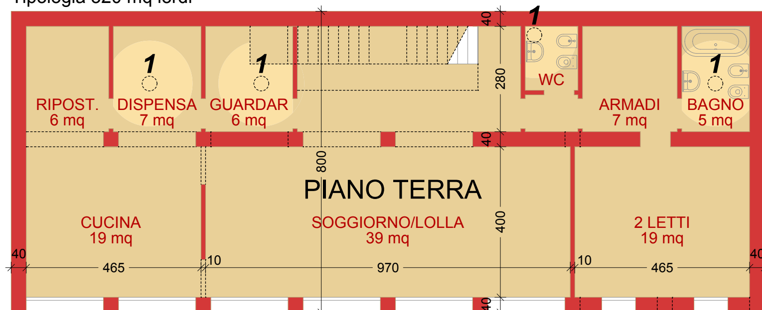
Tipologia 320 mq lordi